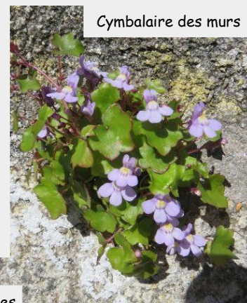
Cymbalaire des murs

Je suis la cymbalaire des murs ; j'ai une gorge jaune bilobée et une lèvre inférieure trilobée. On m'appelle aussi ruine de Rome mais c'est très injuste, même si j'adore les vieux murs.