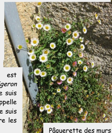
Pâquerette des murs

Je suis la chélidoine et j'appartiens à la famille des coquelicots. Lorsqu'on casse ma tige, un latex jaune, qui a la propriété de faire disparaître les verrues, s'écoule.