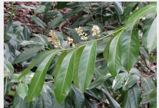
Le Baccharis.