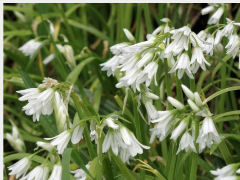
L'ail triquètre.

La première mesure à prendre pour éviter que ces plantes n'envahissent les milieux naturels est, bien sûr, de ne pas en acheter pour son jardin ou son plan d'eau.