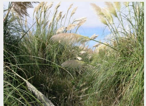
L'herbe de la pampa.